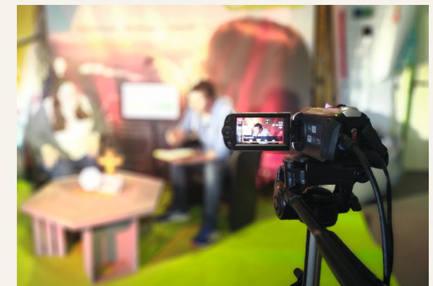
Mit guter Technik werden unsere Andachten ins Internet übertragen.

Projektnummer 300 – Stichwort: Bibel online