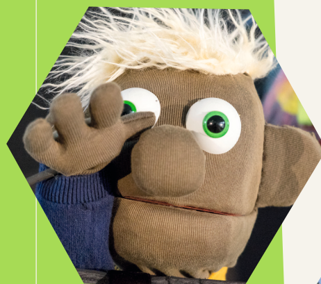
Kinder mögen die Puppen von Team-EC